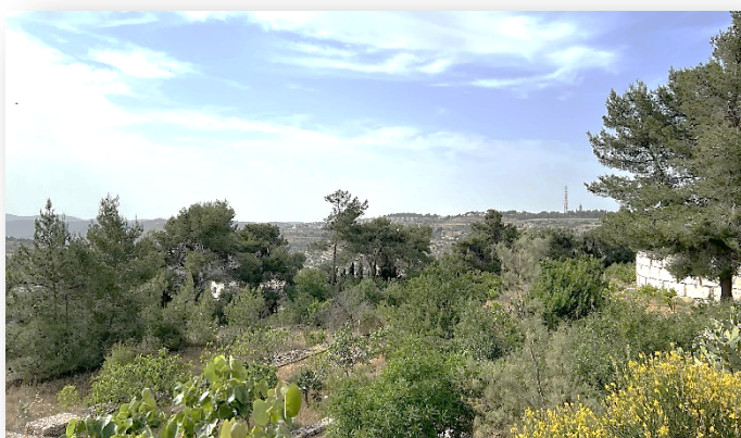
Miljøsenderet med utsikt mot israelske settlements

Gjennom det omfattende skolearbeidet når kirken ut til mange i lokalsamfunnet. De fleste elevene er muslimer, noe som også gjelder for det flotte speiderarbeidet. Den lutherske kirkens samfunnsinnsats er langt større enn antall medlemmer på rundt 2000 skulle tilsi. Denne gangen har jeg lagt ved hele rapporten fra kirken hvor man kan lese om lokalt menighetsarbeid i tillegg til andre aktiviteter.