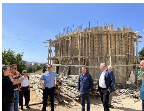
I tilknytning til byggeprosjektet i Betlehem bygges også et nytt kapell i tilknytning til kirkegården rett bak forretningsbygget

Kirkens likviditet er elendig, så det var spørsmål om man ville klare å utbetale lønninger til de ansatte i juni. Kirken står selv for om lag 80 % av inntektene, mens resten kommer fra partnerkirker. Det er et problem at mye av midlene fra partnerne er øremerket til enkeltmenigheter og prosjekter, noe som gir kirken liten fleksibilitet til å styre økonomien til beste for hele kirken. Partnerne oppfordres derfor til å gi ikke-øremerkede midler, noe vi alt gjør fra Kirkerådets side.