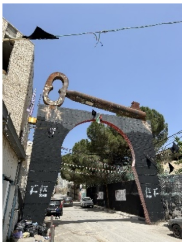
Håpet om å få vende tilbake til hjemmet en forlot i 1948, lever fortsatt i Beit Jala

Det blir stadig tydeligere at den israelske politikken er basert på etnisk og religiøs diskriminering, noe rapportene fra flere anerkjente menneskerettighetsorganisasjoner nylig har dokumentert. «Vi må snakke om 1948 og Nakba». Nasjonalstatsloven fra 2018 som gir jøder særlige rettigheter i Israel, bekrefter at staten er tuftet på diskriminering. Så lenge en grunnleggende forskjellsbehandling videreføres, er det umulig å få til en rettfærdig fredsløsning. Vi oppfordres til å formidle fakta og realitetene på bakken. Det viktige er ikke om vi kaller dette for apartheid, rasisme eller rasediskriminering – men at vi gir et korrekt bilde av hva som faktisk skjer.