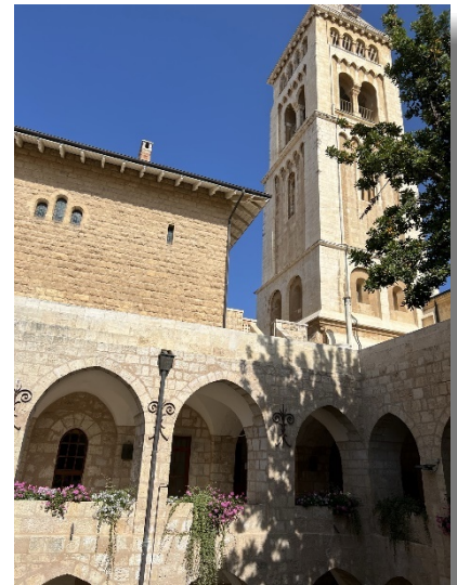
Redeemer Church i Jerusalem